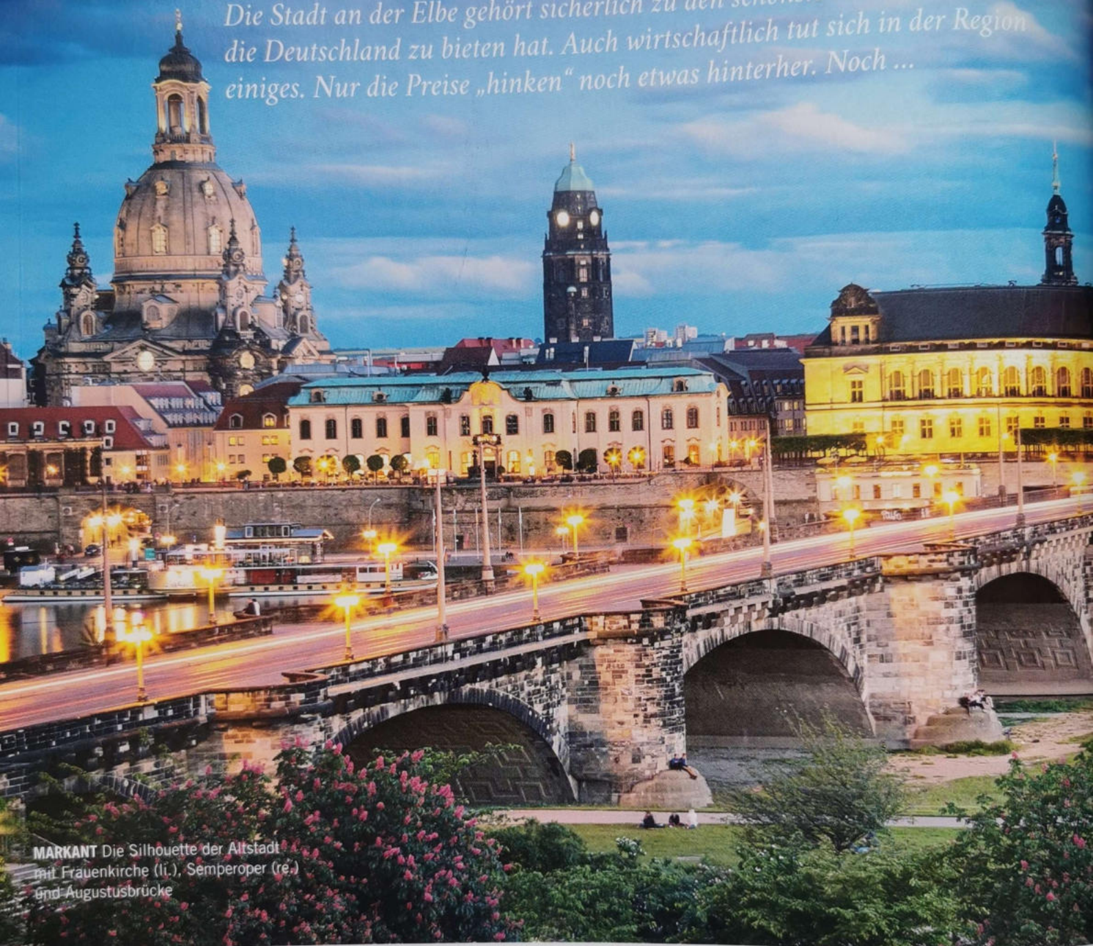
MARKANT Die Silhouette der Altstadt mit Frauenkirche (li.), Semperoper (re.) und Augustusbrücke